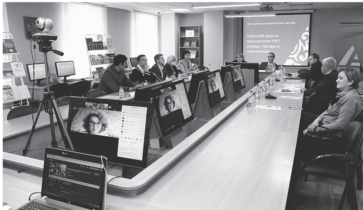
Тема алтаистики – в центре внимания

В рамках «Алтай-Азии 2020» АГУ презентовал Научно-образовательный центр алтаистики и тюркологии «Большой Алтай». Инициатором проведения экспертной сессии выступили Научно-образовательный центр алтаистики и тюркологии «Большой Алтай» Алтайского государственного университета и Ассоциация азиатских университетов.