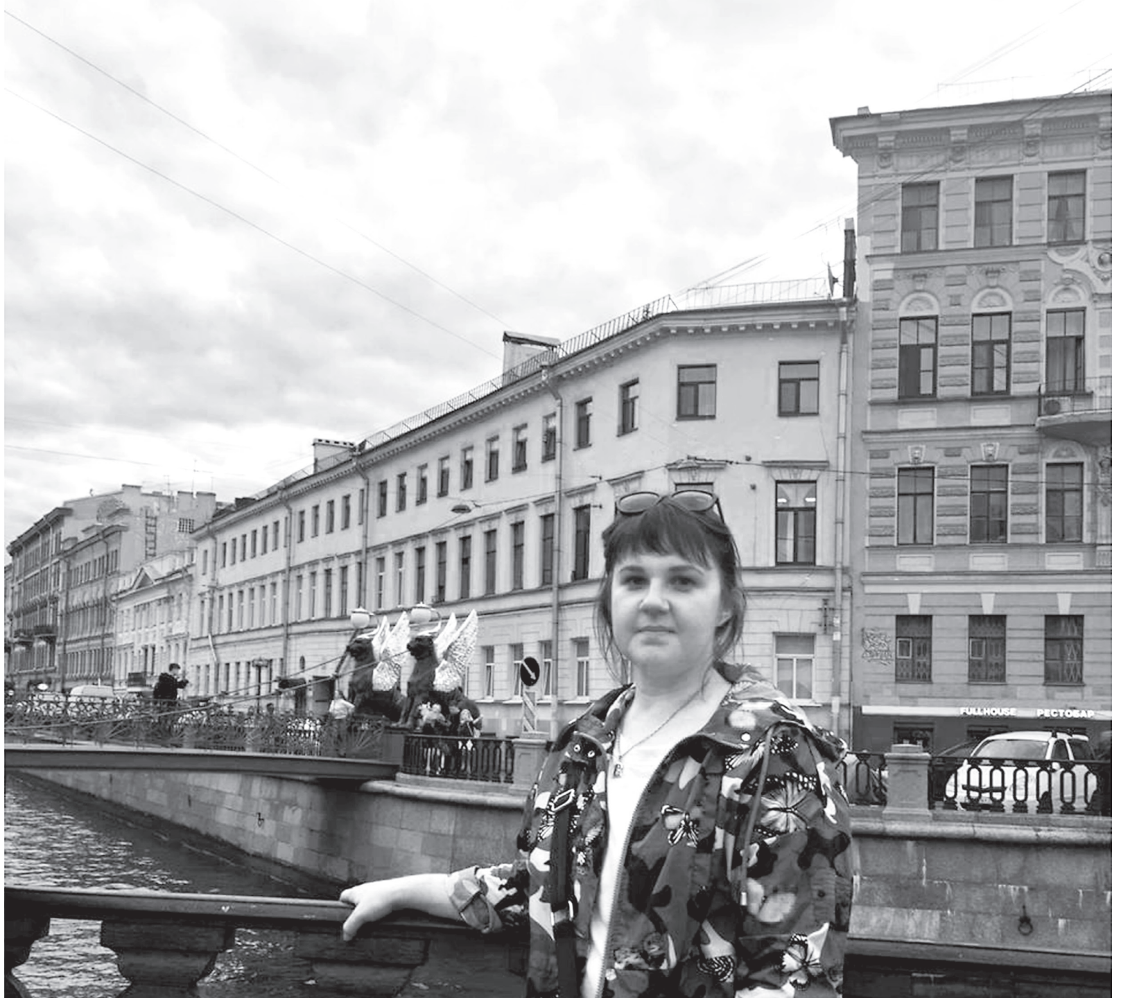
Чтобы сносно заговорить на китайском, необходимы, прежде всего, железное терпение и нервы. Талант тоже не помешает

– Нужно помнить, что этот язык абсолютно не похож на все флективные языки (английский, русский), то есть и законы строения этого языка будут отличными от того как строится русский и английский, соответственно опыта у вас не будет. То есть вам придется учить и усваивать абсолютно другую языковую систему! Честно, в первые годы обучения придется очень много заучивать, «зубрить» наизусть, и это, пожалуй, тяжело! Но самое основное – иероглифика. Это, по сути, петроглифы – наскальные изображения, которые дошли до наших дней и видоизменились. Китайский иероглиф – это 3D-проекция, где каждый иероглиф имеет свое написание, звучание и значение. Так студен-