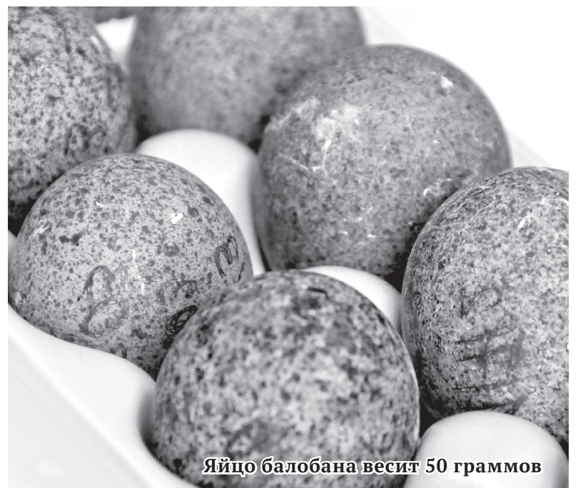
Яйцо балобана весит 50 граммов