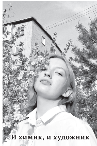
– И химик, и художник

– Я помню, как возвращалась с пар, мне пришло сообщение с предложением нарисовать празд-