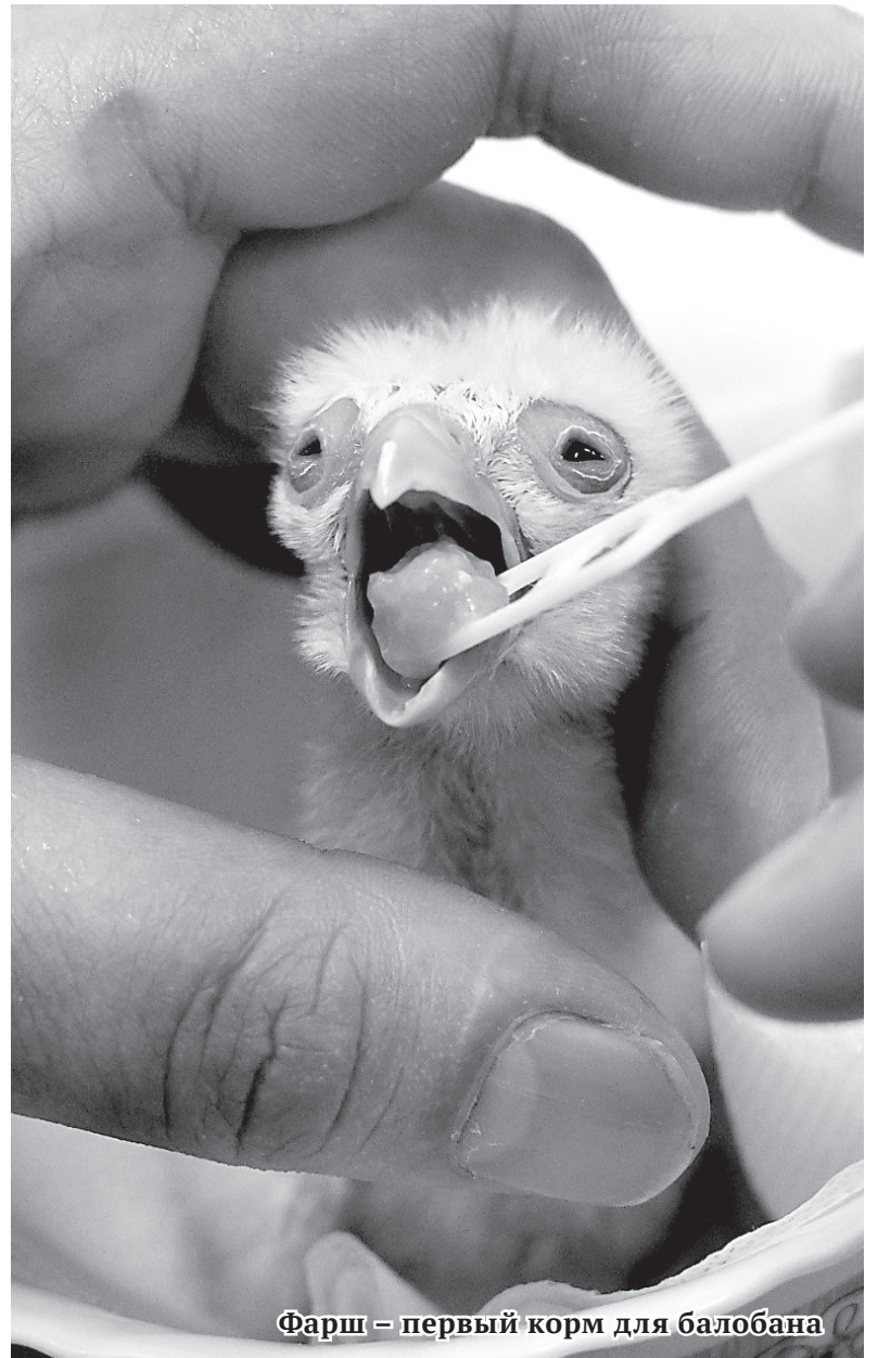
Фарш – первый корм для балобана

Сотрудники лаборатории питомника редких видов птиц «Алтай-Фалькон» Алтайского государственного университета занимаются разведением краснокнижных соколов балобанов. Корреспондент «ЗН» побывали на самом раннем этапе получения потомства, когда птенцы только вылупились из яиц. Выращивание соколов балобанов проходит в рамках проекта «ДНК-определение полового диморфизма птенцов в период раннего постнатального онтогенеза и создание генотипического кадастра представителей алтайской популяции балобана». Он реализуется учеными зоологического центра института биологии и биотехнологии АлтГУ в рамках программы «Приоритет-2030».