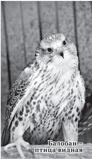
Балобан – птица видная