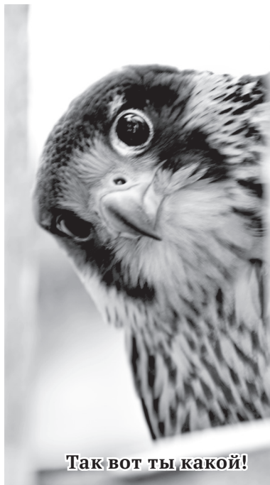
Так вот ты какой!

Окрас у балобанов бурый с окристыми вкраплениями. Но среди них встречаются и уникальные особи с темным оперением – так называемые алтайские соколы. Они сильнее и крупнее своих бурых собратьев. В природе их существует примерно 10%. Ученые АлтГУ планируют выделить темную морфу в отдельную племенную группу. Темная морфа – популяция с темным окра-