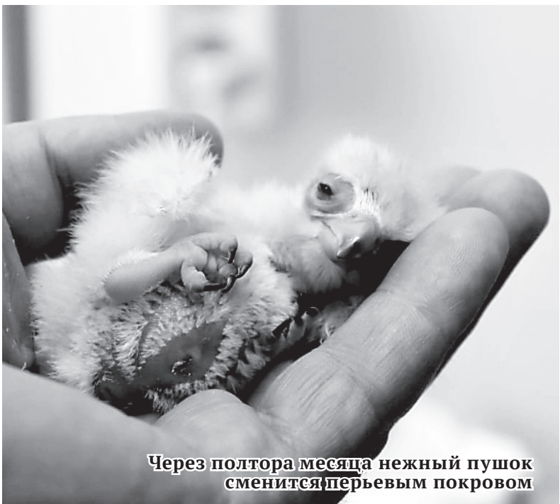
Через полтора месяца нежный пушок сменится перьевым покровом