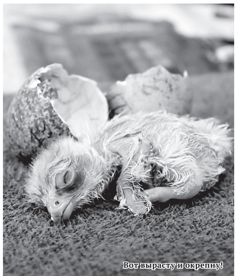
Вот вырасту и окрепну!