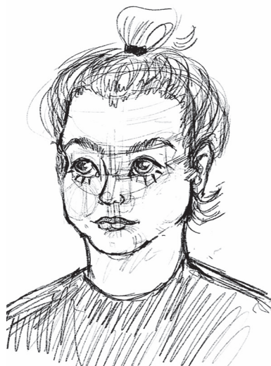
Девочка в поезде

ничную обложку для газеты. Я была в приятном шоке. И, естественно, согласилась! Потому что это классный опыт, возможность показать свои способности и заявить о себе. Помимо прочего, я делаю разные наброски, рисуя прохожих на улице. У меня часто бывает такое, что разглядываю лица незнакомых людей, а потом быстро их зарисовываю. Хочется уловить и запомнить их черты. Я вообще люблю рисовать людей, не так давно нарисовала портрет маленькой девочки в поезде. Ее маме понравилось.