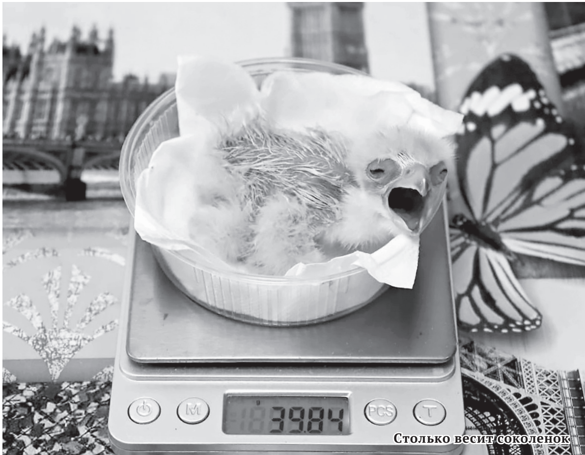
Столько весит соколенок