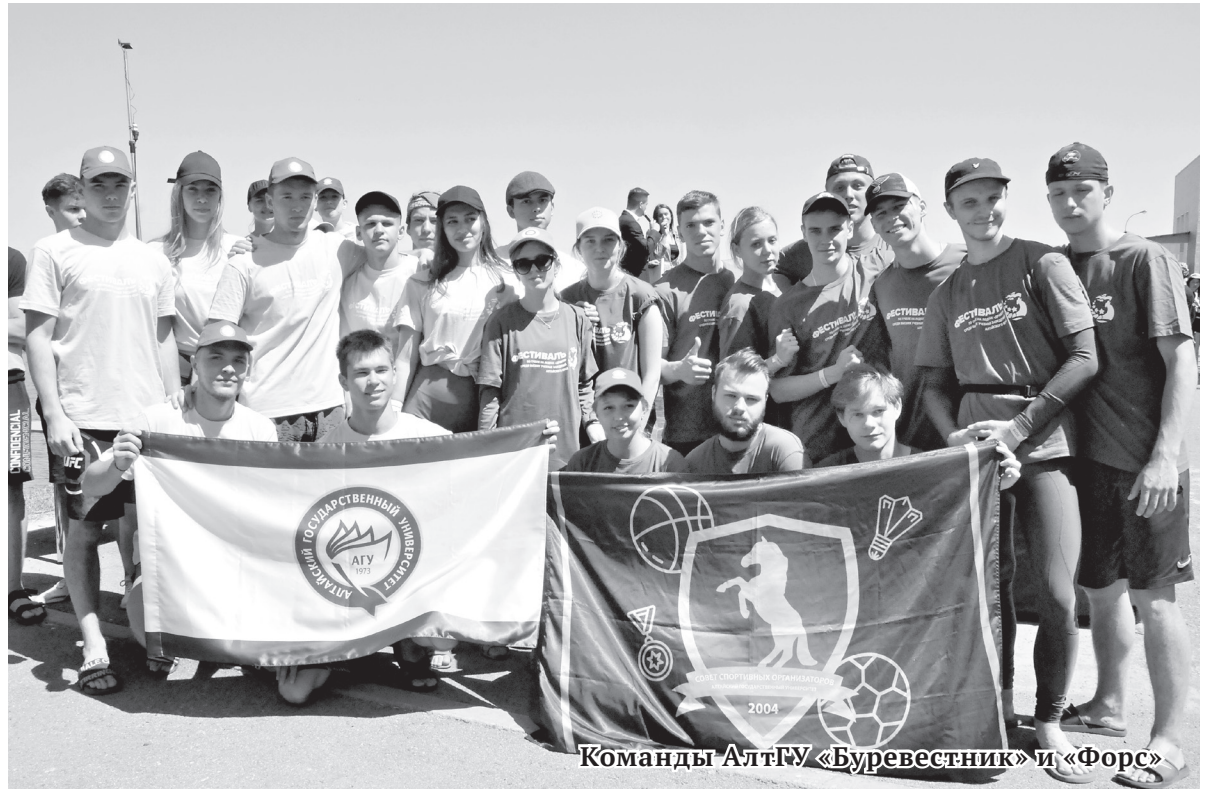
Команды АлтГУ «Буревестник» и «Форс»