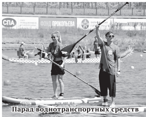
Парад воднотранспортных средств