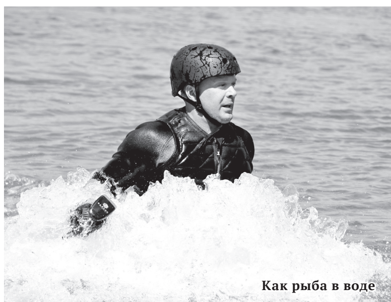
Как рыба в воде