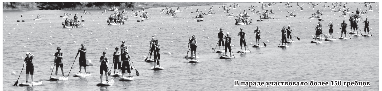
В параде участвовало более 150 гребцов