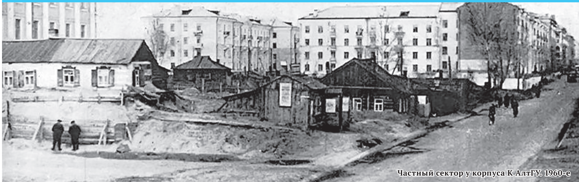
Частный сектор у корпуса К АлтГУ. 1960-е