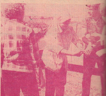
ЗАКОНЧЕН ТРУДОВОЙ ДЕНЬ, А ТЕПЕРЬ ПОРА.