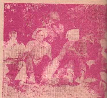
ВКУСЕН ОБЕД НА СВЕЖЕМ ВОЗДУХЕ.