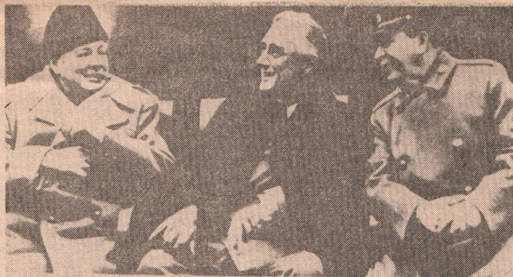
Справа налево: И. В. Сталин, Ф. Рузвельт и У. Черчилль