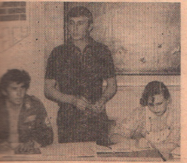
в время заседания штаба ССО, секретарь комитета