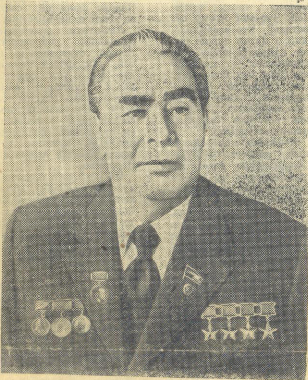
Генеральный секретарь ЦК КПСС, Председатель Президиума Верховного Совета СССР Леонид Ильич Брежнев.