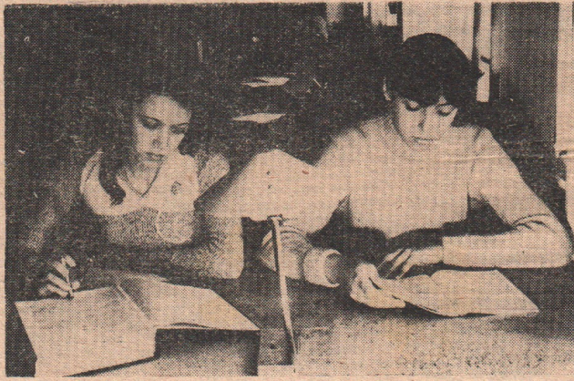
Сообщают студкоровские посты

НА СНИМКЕ: в читальном зале библиотеки.