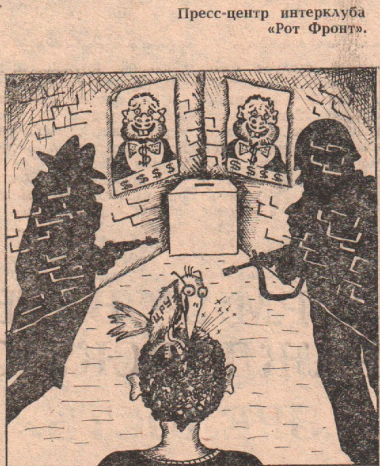
«Свободные выборы» на Гренаде.

Публикация подготовлена по материалам центральной прессы.