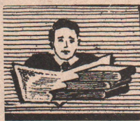
А. И. КУПРИН.

Конец рассказа неожиданный. За годы одиночного заключения арестант-философ приходит к выводу, что все богатства — одна суeta.