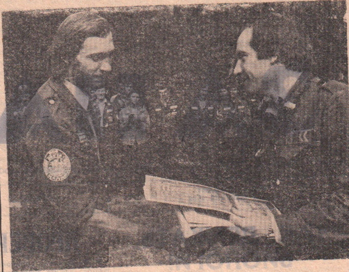
перечислить всего, что принесло это бедствие людям, а благодарность жителей Тальменки. Провожая нас, они приглашали приез-

Итак, начало положено. В добрый путь, «Верис»!