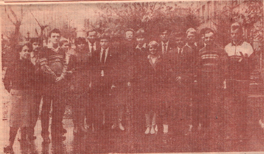
Как живешь, группа?