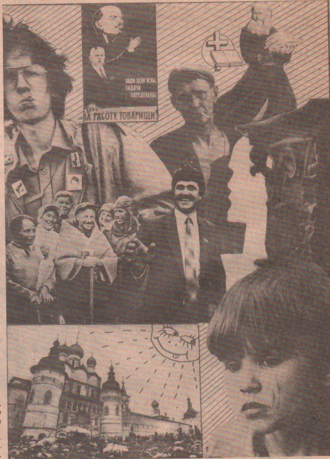
Коллажи М. Хаустова

Малозвестные и неизвестные факты, изложенные бывшим офицером ВВС, у которого, как и у М. С. Горбачева, в первый день путча (19 августа 1991 г.) отключено телефон, читайте сегодня на вкладыше газеты "ЭН".