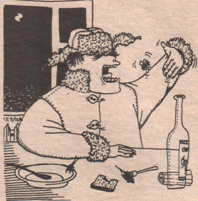
Э. ВИНТЕРКОМТ. Рисунок Константина Семенова.

Совет 6. которым в течение тысячелетий в тепле пользуются чучки.