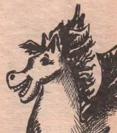
Рисунки Татьяны Потапкиной, Вячеслава Корнева.

И, видно, потому был сын здоров и гладок. И горек был ему тот хлеб, что нам был садком.