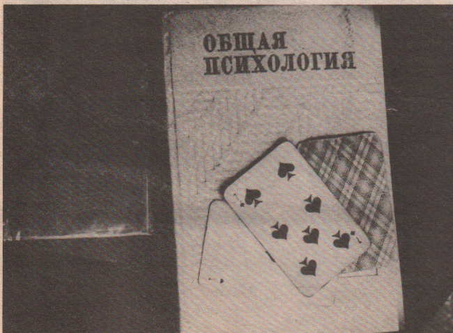
Фотоэтиюд М. Хаустова