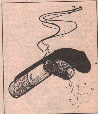
Рисунок К. Леонтьева.

Адрес: Леповская, 7, кабинет Восточной Медицины, инст. АЛТАЙГРАЖДАН- ПРОЕКТ