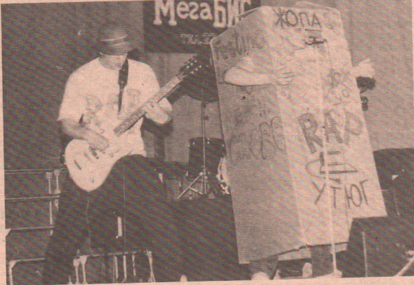
Рок-хит "Дубовой рощи"