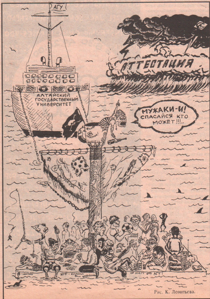
Рис. К. Леонтьева.

Билеты в кассе дворца спорта и у распространителей.