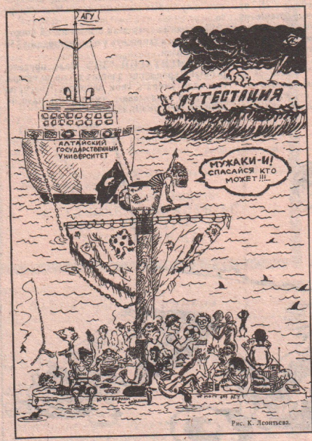
Рис. К. Леонова.

Г.Р.ЖОВА , доктор хим. наук, профессор, зав. кафедрой ТГУ