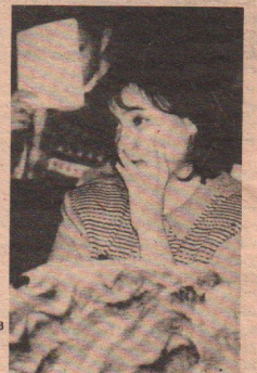
Беседовал В.Максимов

Владимир (представитель больше отказался): "По правде говоря, я ожидал большего. А пока видна не только апатия со стороны студентов, но и некоторая рассеянность председателя. Некоторые злободневные вопросы опущены. Например, история с Палагиным и отношение к ней СС, прошедшая аттестация и СС. Дальше так нельзя. Иначе СС потеряет лицо работающей организации."