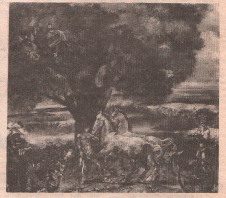
Да будет вам известно...