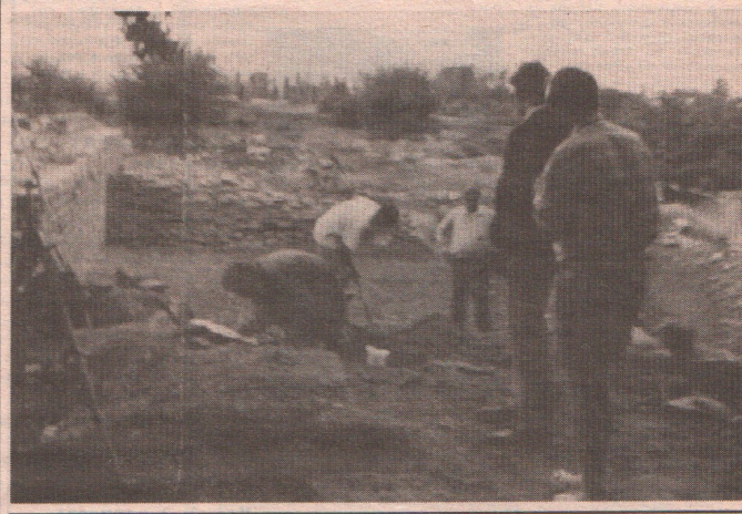
"Интенсивные раскопки в Дионе продолжались прямо у нас на глазах..."

"монашеское государство". В 20 крупных монастырях и в многочисленных скитах проживает сейчас около 1700 монахов, среди которых есть не только греки, но и русские, сербы, болгары.