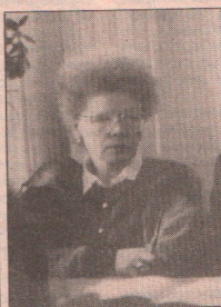
5 февраля в Москве пройдет юбилейное заседание