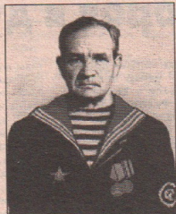
(Окончание на 2 стр.)