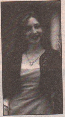
всем, в общем. В школе нравилась физика, литература, очень любила историю. Вот в историю я знаю практически все от А до Я. А остальное просто мне нравится.

- Есть у тебя такая область, о которой ты могла бы сказать: это мое, я в этом дока? - Много знаю о рисовании, хотя понемногу разбираюсь во