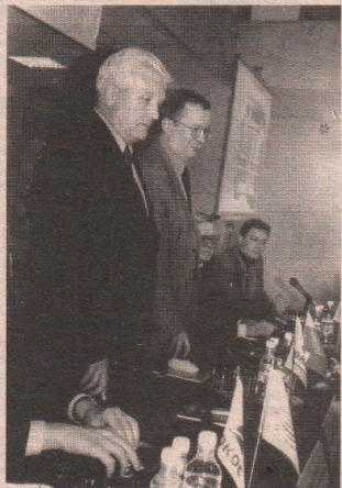
На снимке: вот так разрезаются виртуальные ленточки