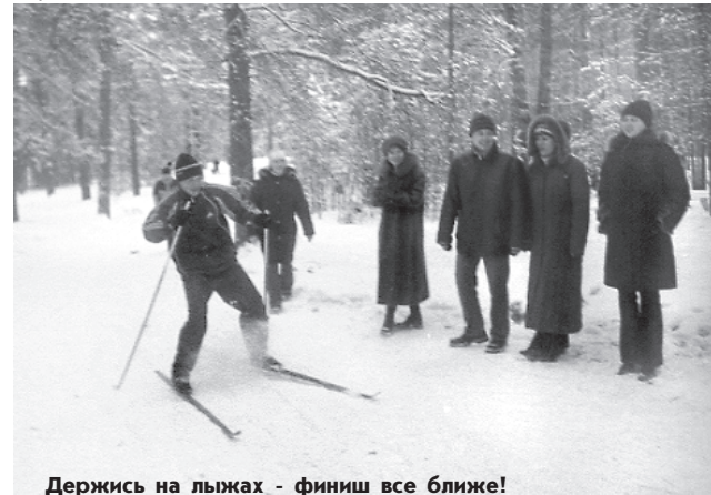
Держись на лыжах - финиш все ближе!