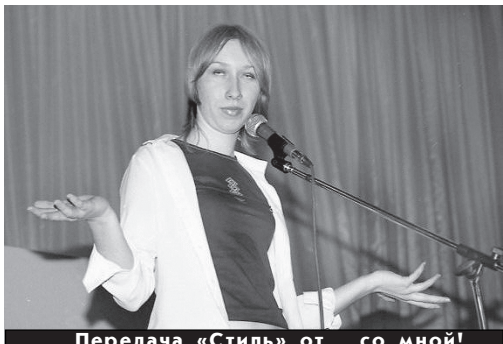
Передача «Стиль» от... со мной!