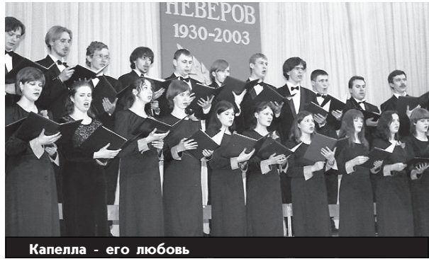
Капелла - его любовь

Очень порадовало слушателей концерта выступление лауреата Демидовской премии ансамбля «Руснари», известного не только в крае, но и за рубежом.