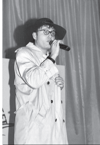
Красоту ничем не скроешь!

Качественный СТЭМ представил «3 этаж», исследовавший границы электронного разума. Находка - оживление компьютерного сленга. Давно было пора обзавестись «чайником», что такое на самом деле мыш, для чего нужна корзина и файлы с расширением sys и что разрешение кое для кого никакое. Для ламеров была специальная неспециальная шутка: - Какой фрукт самый красный? - Банан в крови. «Винегрет» в СТЭМе еще раз продемонстрировал свое неравнодушие к отечественным войнам и спорту. Из первых была выбрана Отечественная война 1812 г., а из спорта - бокс. Наполеон Буана-