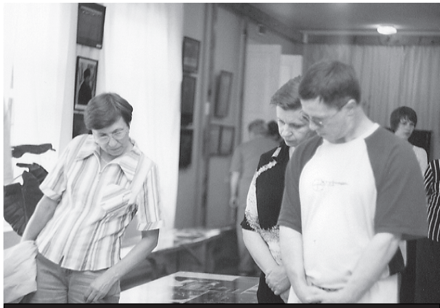
Вещи могут рассказать многое, и от экскурсии по музею не отказывался никто.

Традиционные Шукшинские чтения, на сей раз юбилейные (в 75-ю годовщину со дня рождения писателя), проходившие этим летом на родине Василия Макаровича, в селе Сроетки, традиционно посетили преподаватели, аспиранты и студенты нашего университета. О том, что и как происходило в Сроетках, вы наверняка уже знаете. Мы предлагаем читателям фоторепортаж, ведь за всем происходящим следил зоркий объектив фотографа «За науку» Инны Кашкаревой.