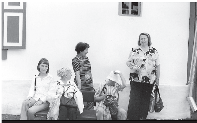
Приятные минуты отдыха (у дома матери Шукшина)