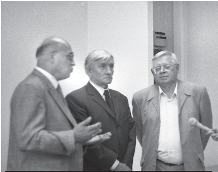
В кулуарах: справа - ректор АГУ проф. Ю.Ф. Кирюшин

Представитель администрации Алтайского края отметил, что открытие кафедры - это событие в истории города и прекрасный подарок горожанам в преддверии праздника. Шаг