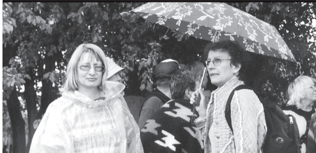
Дождливая погода не испугала гостей из Польши (справа)