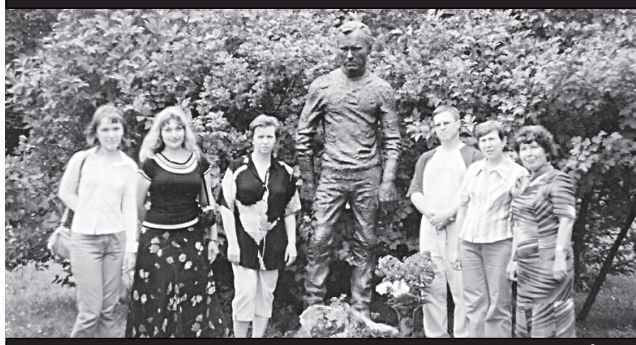
Василию Макаровичу несли цветы и всенародную любовь