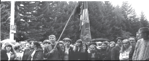
Впереди у них - пять счастливых лет!

Молодое поколение радовалось, потрошило шоколадки и немного скучало к концу мероприятия. Случайно забредшие на линейку «старички» злорадно шептались: вы, мол, ребята, еще не знаете, что вас ждет! А что их ждет? Лекции, семинары, сессии, студенческие вечеринки... Особенно трудолюбивых и целеустремленных - повышенная стипендия и грамоты-дипломы, тех, кто поленился - задушевные беседы с преподавателями на переменах. В целом же - ничего плохого и масса