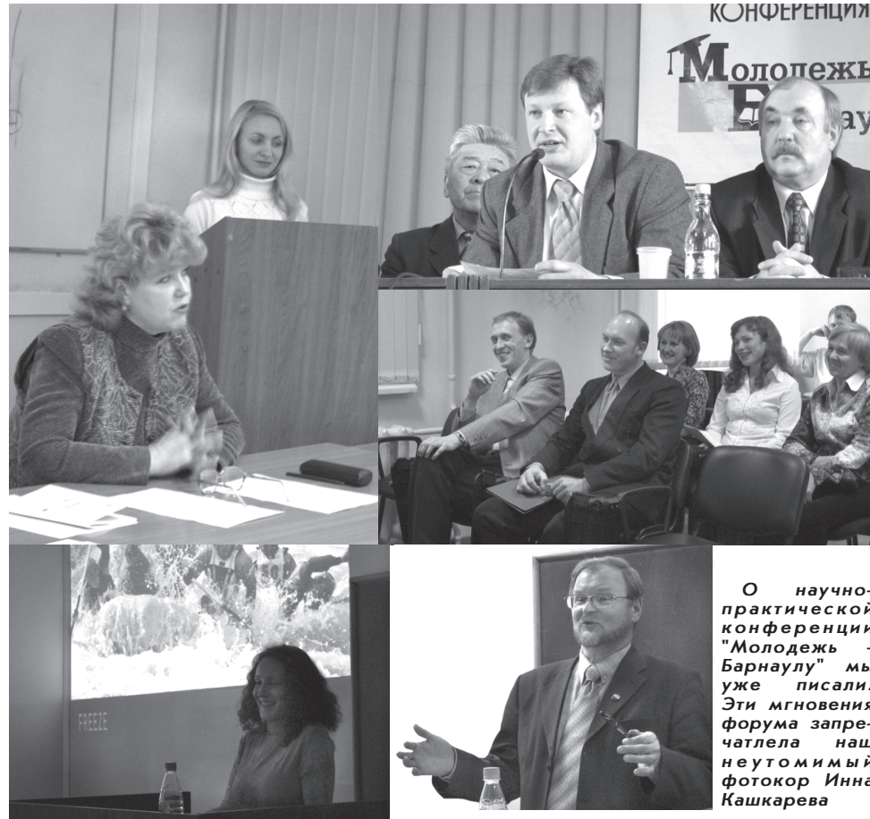
О научно-практической конференции «Молодежь - Барнаулу» мы уже писали. Эти мгновения форума запрещалось не утомимый фотокор Инна Кашкарева