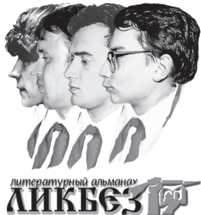
Материалы выпуска подготовил В.В. Корнев

т.е. самораспустить. И придя по одиночке к своим друзьям, они услышали о неведомом им стаде, и все эти трое бывших стадных слонов начали сильно бояться его. И еще очень долго в кустах, бежал по джунглям и, ломая по пути баобабы, кричал: «Стадо идет!»