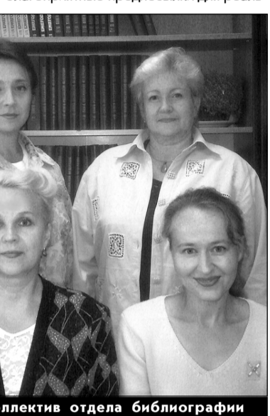
Коллектив отдела библиографии

формационных ресурсов, сконцентрированных в библиотеке, нас заставляет время. Вместо ограниченного набора фондохранилищ образование начинает опираться на всемирную виртуальную библиотеку, охватывающую неизмеримо большее количество разнообразных источников информации. И здесь мы не стоим на месте. На новом сайте нашей библиотеки можно познакомиться с полнотекстовыми журналами, признанными мировым научным сообществом. Привлечение информационных ресурсов удаленного доступа, таким образом, создает благоприятные предпосылки для реального