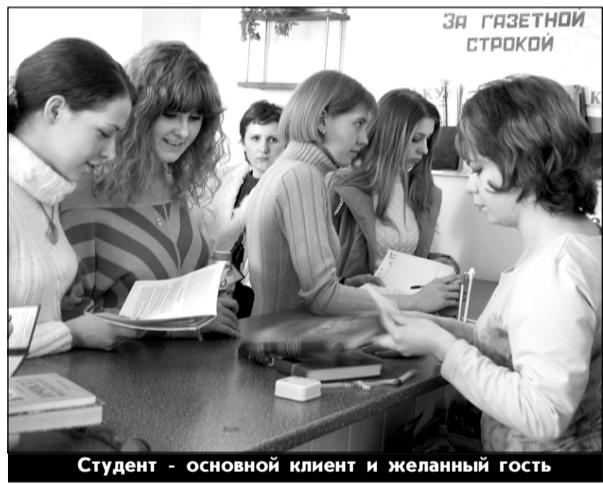
Студент - основной клиент и желанный гость