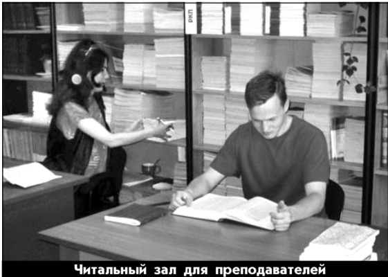
Читальный зал для преподавателей

НИС - старший научный сотрудник. Прием документов на конкурс проводится в течение месяца после опубликования объявления.