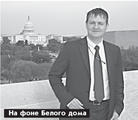
На фоне Белого дома

- Учитывая тенденцию интернационализации высшего образования и в силу специфики направлений подготовки, юридический факультет принимает активное участие по интеграции в международное академическое пространство. Благодаря активной работе преподавателей в этом направлении и живому интересу студентов ЮФ имеет партнерские отношения с США, со странами Западной и Восточной Европы, а также Ближнего Зарубежья.