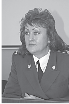
Материал подготовила Татьяна Рыбина

На встрече также были затронуты проблемы, связанные с преступностью в нашем городе: одной из которых стала проблема борьбы с экстре-