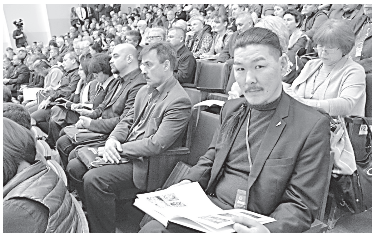
Съезд собрал около 500 ученых со всей России, ближнего и дальнего зарубежья

человеком Евразии», «Археология московского Кремля: результаты новейших исследований», «Хронология и периодизация нижнего палеолита северного Кавказа», «Археологическая деятельность В.В. Радлова на Алтае и современные направления исследований сотрудников АГУ» и другие.