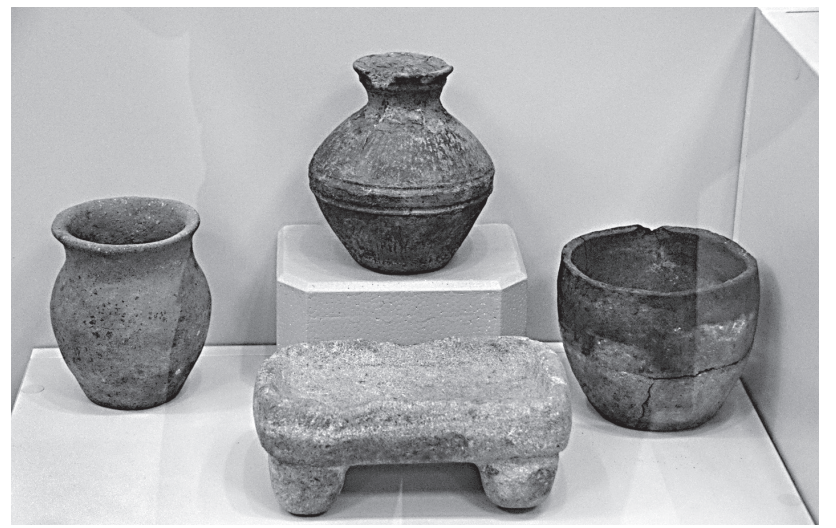
Новая экспозиция Музея археологии АГУ

Камни вызвали любопытство, и то и дело здесь устраивались фотосессии.