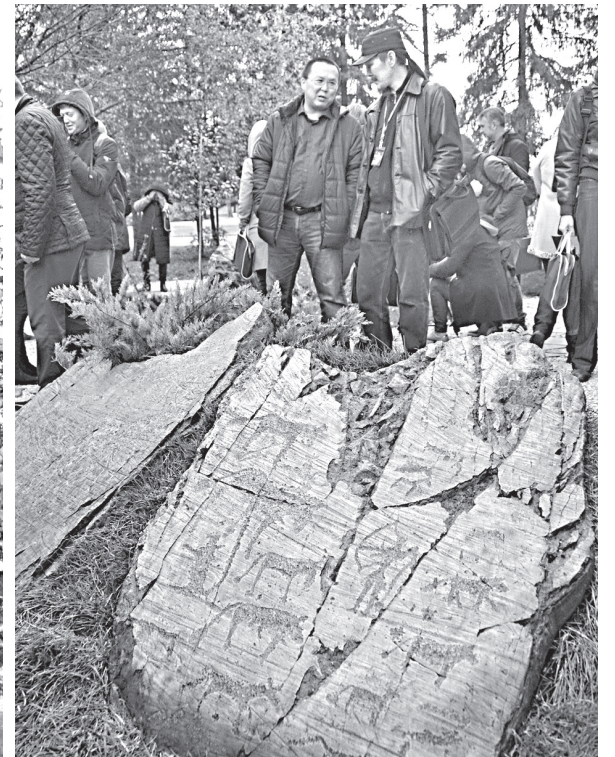
Петроглифы в центре Барнаула