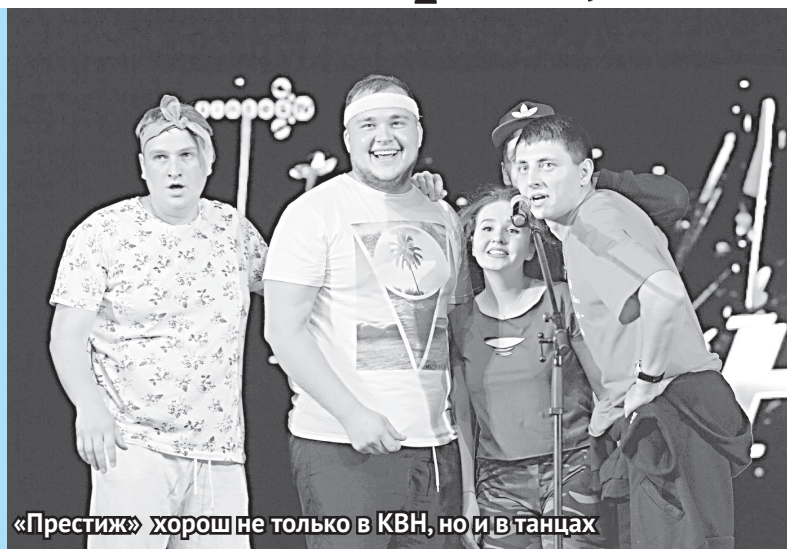
«Престиж» хорошо не только в КВН, но и в танцах