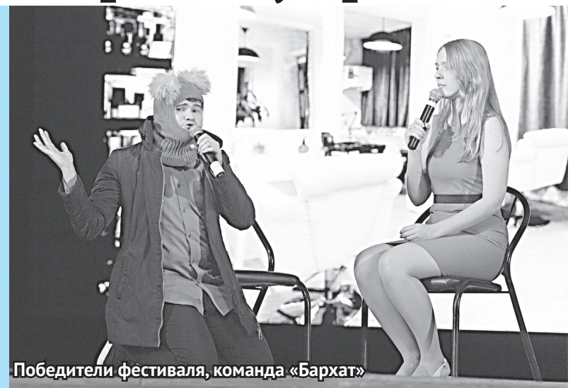
Победители фестиваля, команда «Бархат»