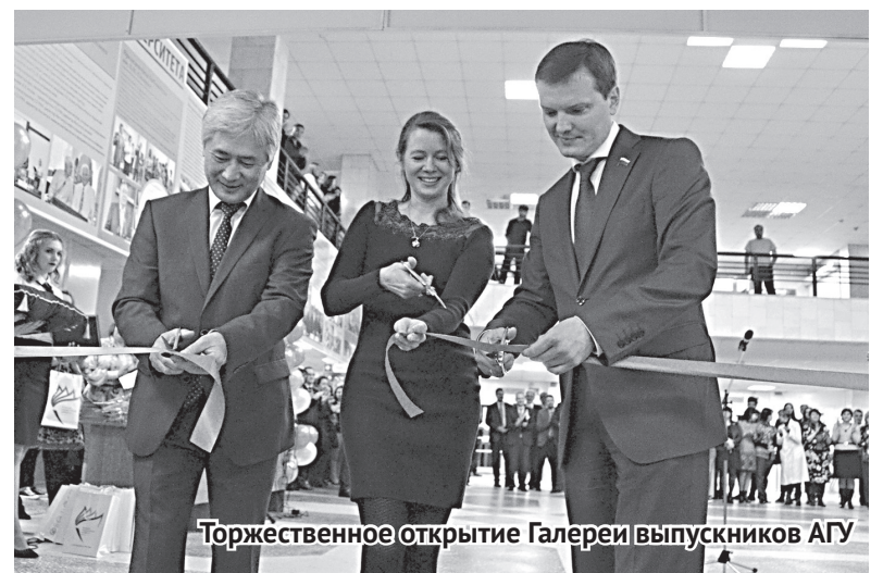
Торжественное открытие Галереи выпускников АГУ