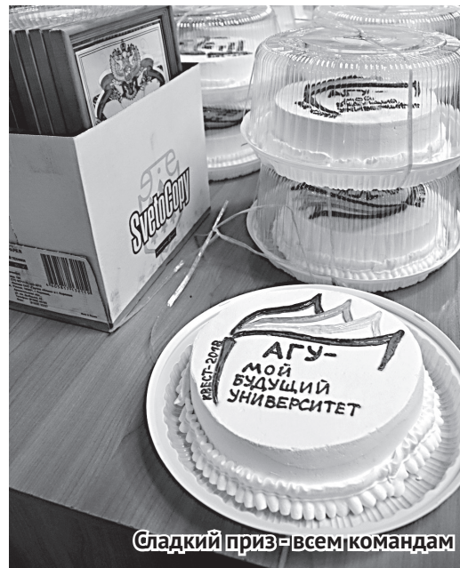
Сладкий приз – всем командам