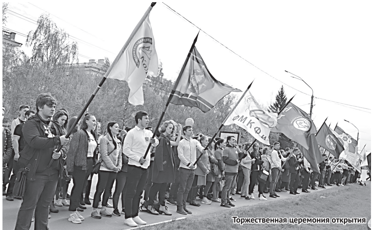
Торжественная церемония открытия