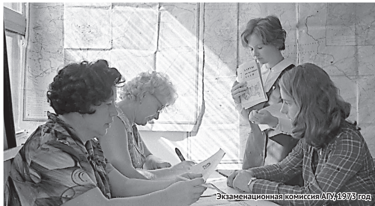
Экзаменационная комиссия АГУ, 1973 год

Дело осложнялось тем, что в министерствах (союзных и республиканских) имелась серьезная оппозиция открытию университета на Алтае, даже со стороны министров. Считалось, что «потребность в специалистах-универсалах вполне может быть удовлетворена за счет подготовки в университетах цен-