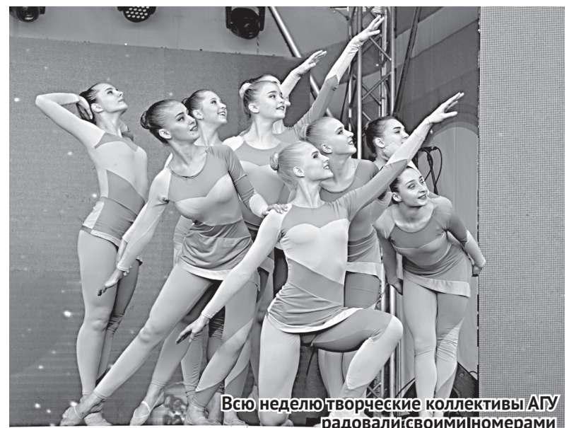
Всю неделю творческие коллективы АГУ радовали своими номерами

«Университет живет благодаря тому, что есть основа – учителя. Они развивают учеников и сам университет, и процесс этот бесконечен. И сейчас на смену учителям приходят их ученики. Наш факультет естественных наук объединял химиков, математиков и биологов. Наши первые