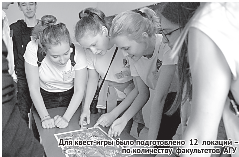
Для квест-игры было подготовлено 12 локаций – по количеству факультетов АГУ