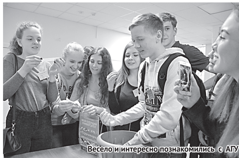
Весело и интересно познакомились с АГУ

После квест-игры школьников ждали приятные сюрпризы. Все ребята получили сертификаты участников, подарочные наборы с символикой нашего университета и белоснежный торт с эмблемой АГУ. А каждый участник команды-победителя «Нестандартного варианта» – сертификаты со скидкой на под-