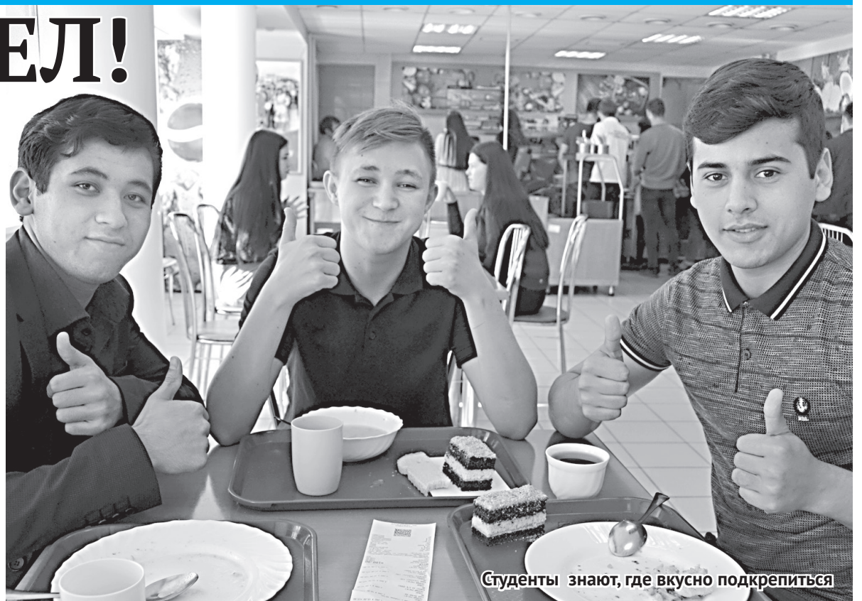
Студенты знают, где вкусно подкрепиться

А если серьезно, то каков студент, таков и спрос. Одни берут молочные каши, и таких довольно много, другие просят гуляш или плов. Но чаще всего берут уже упомянутые сырный суп или борщ классический, отбивную с курицей, свиные и говяжьи котлетки. Хорошо раскупают пиццу, причем лю-