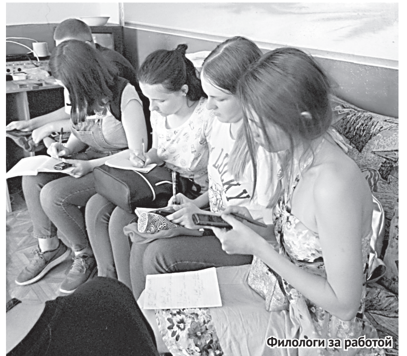
Филологи за работой

стигла гроза! Было очень страшно, и чтобы отвлечься от нагнетающих мыслей, мы решили запеть «Катюшу». Представляете эту картину? Горы, гром, молнии, сильный ветер и две девчонки с рюкзаками за плечами бегут и кричат