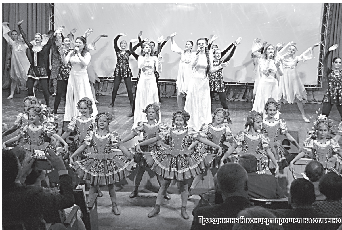
Праздничный концерт прошел на отлично

Свидетельства о вступлении в должность вновь избранным руководителям ассоциации были вручены в ходе общего собрания. А красивую традицию торжественной передачи атрибутов и символа ассоциации приберегли для более неформального мероприя-