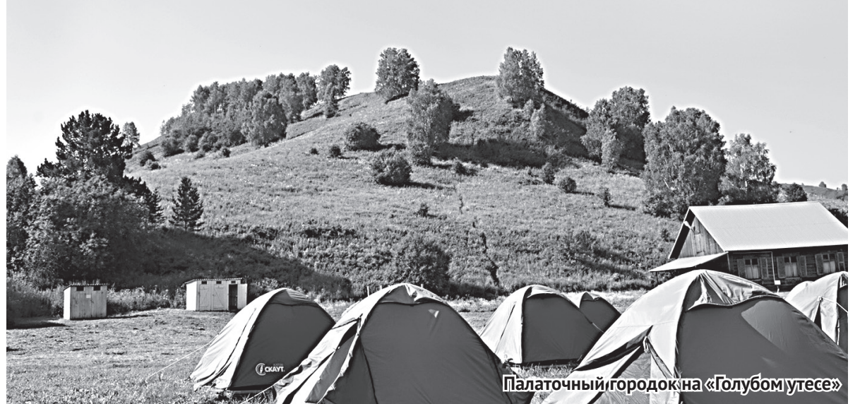
Палаточный городок на «Голубом утесе»

Материала нам удалось собрать не очень много. Обычно люди нам отвечали, что уже ничего не помнят, и посылали от дома к дому, от человека к человеку. Но мы все-таки собрали немного частушек, песен, преданий и легенд. Например, мне посчастливилось узнать