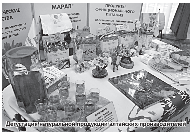
Дегустация натуральной продукции алтайских производителей

подрастающего поколения единства системы мира. Я убежден, что без качественного отечественного образования не будет никакого движения вперед, никакого развития. Наше национальное достоинство – это в первую очередь наука и образование!» – подытожил академик РАН.