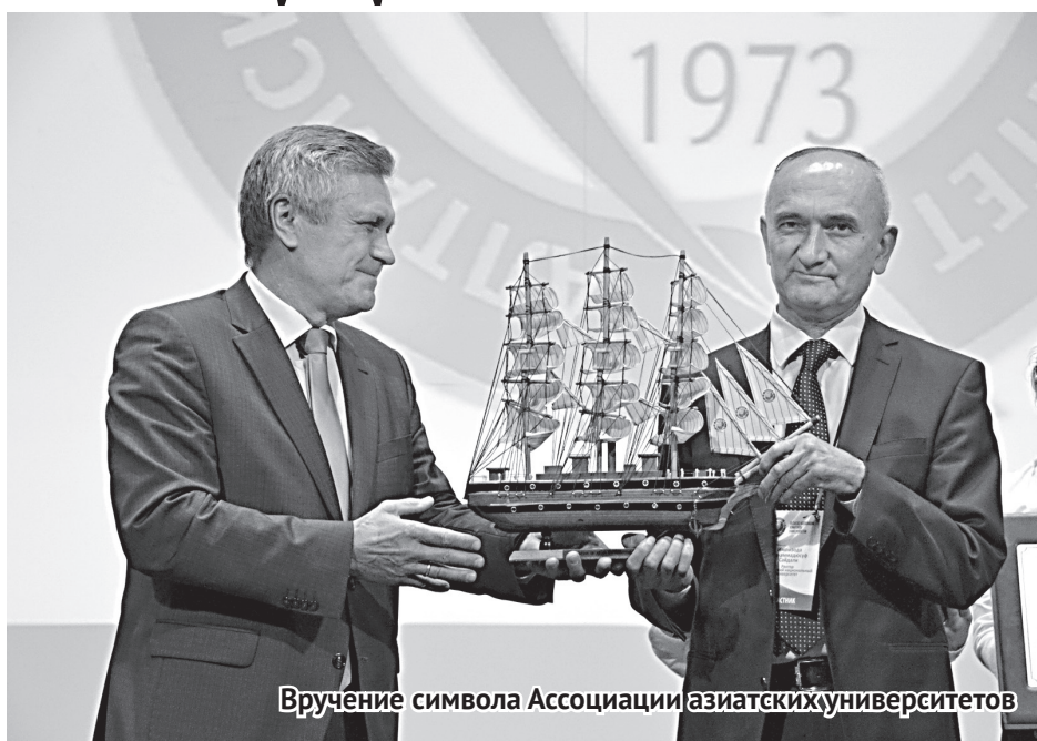
Вручение символа Ассоциации азиатских университетов