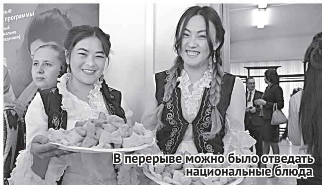
В перерыве можно было отведать национальные блюда

20 сентября в Алтайском государственном университете состоялось торжественное открытие III Общего собрания Ассоциации азиатских университетов