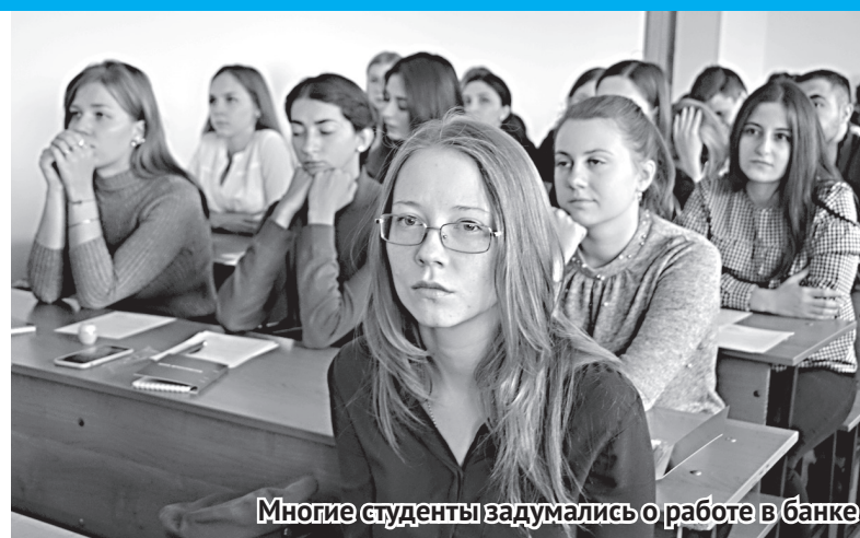
Многие студенты задумались о работе в банке

Многих студентов волновала возможность пройти практику, не «перебирая бумажки», на что они услышали, что стажеров привлекают к работе во