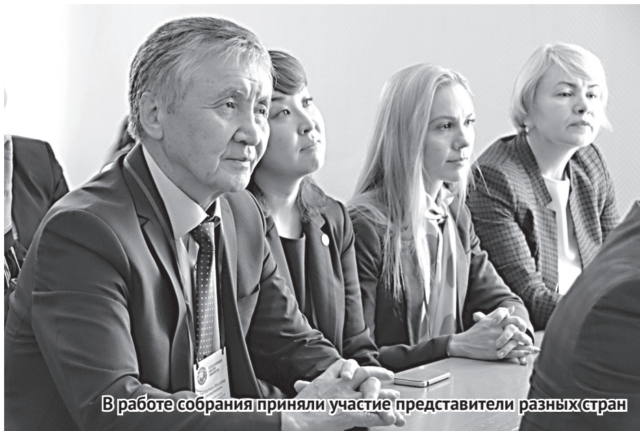
В работе собрания приняли участие представители разных стран