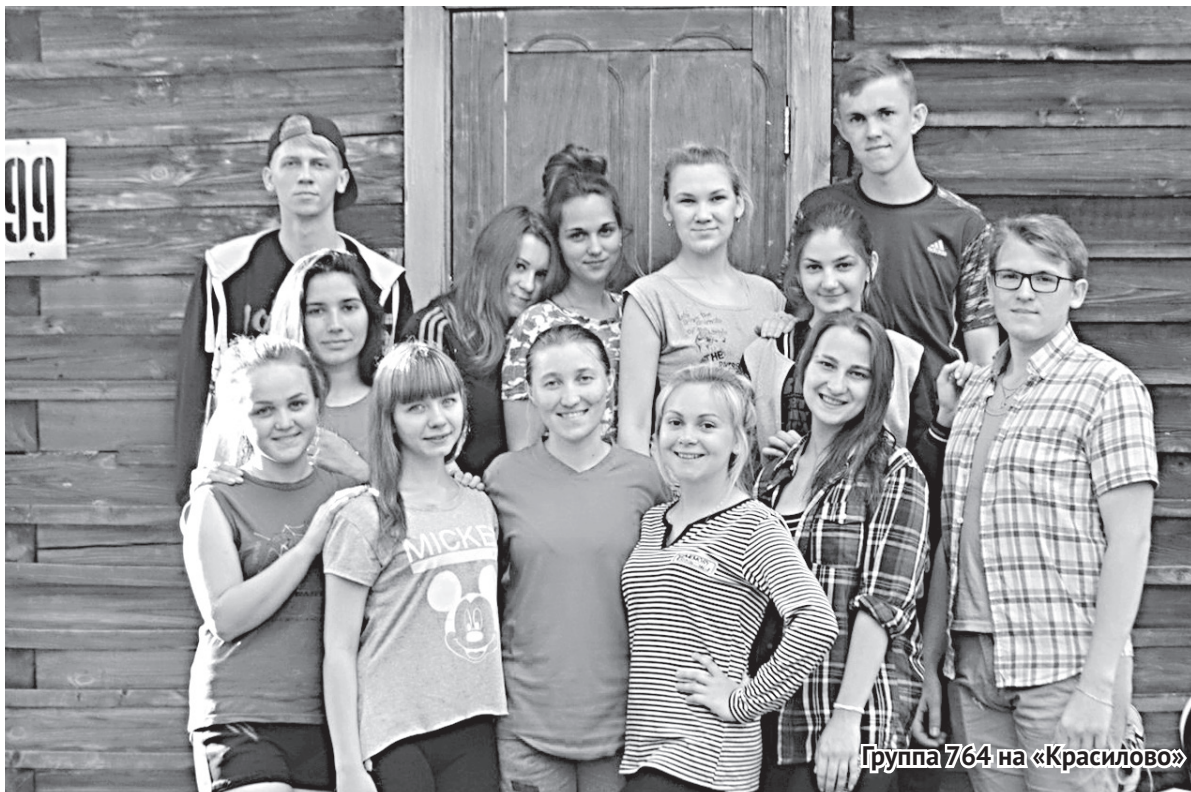
Группа 764 на «Красилово»