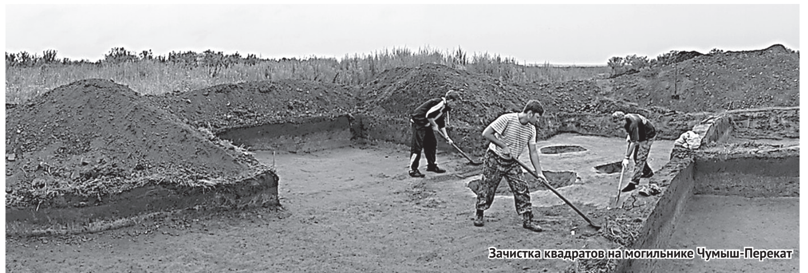
Зачистка квадратов на могильнике Чумыш-Перекат