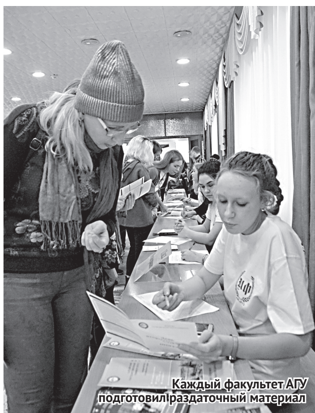
Каждый факультет АГУ подготовил раздаточный материал