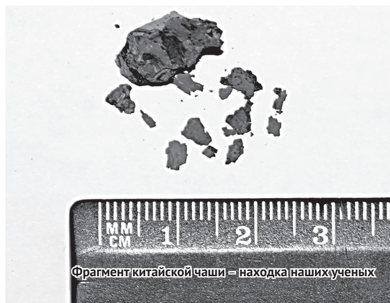
Фрагмент китайской чаши – находка наших ученых

особую научную значимость имеют остатки деревянного лакового предмета, вероятно, чашечки, изготовленной в Древнем Китае. Предмет (возможно, это остатки даже двух предметов) сильно пострадал из-за ограбления кургана в древности. Тем не менее достаточно хорошо просматривает-