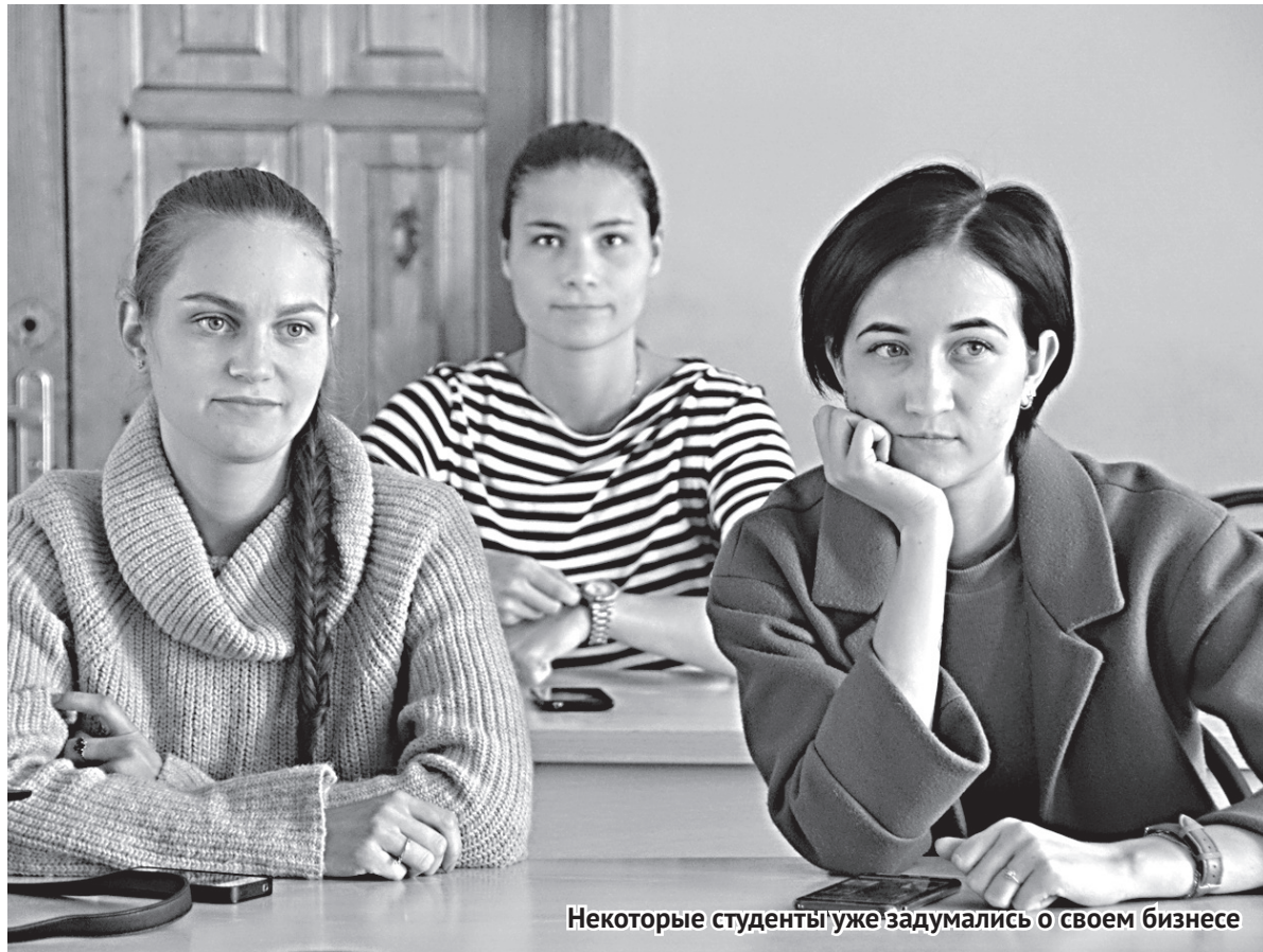
Некоторые студенты уже задумались о своем бизнесе