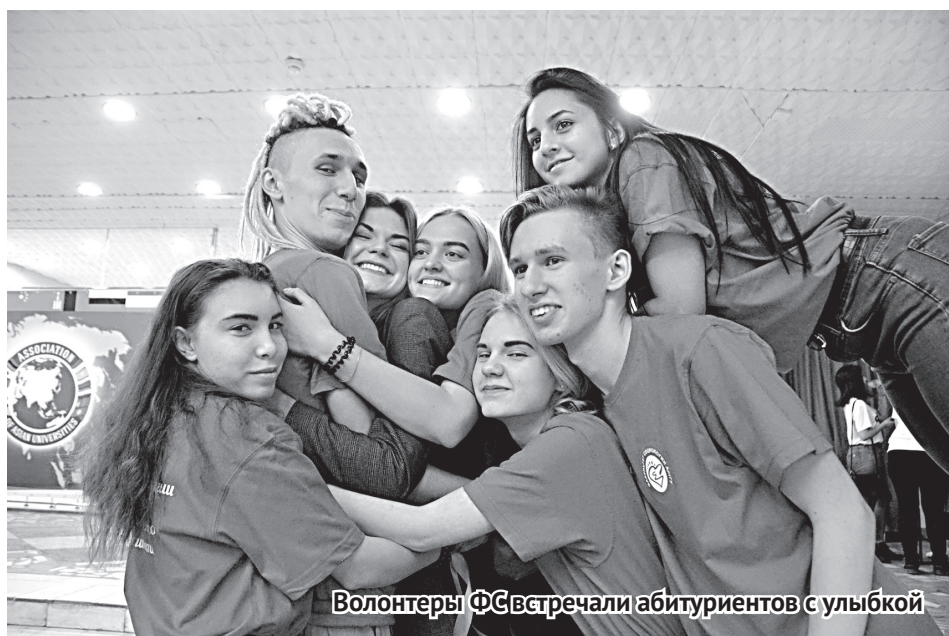
Волонтеры ФС встречали абитуриентов с улыбкой