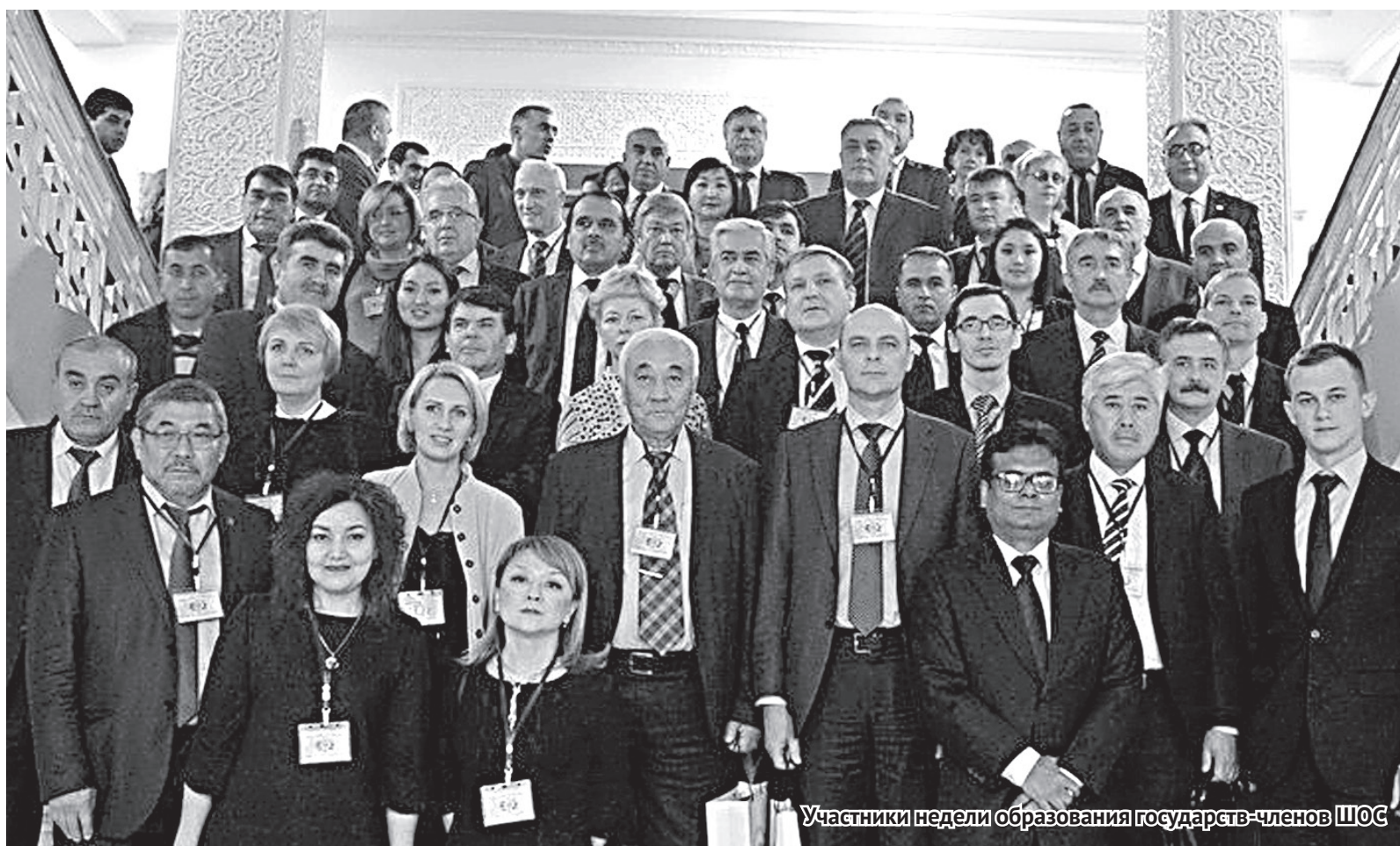
Участники недели образования государств-членов ШОС