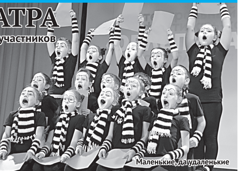
Маленькие, да удаленькие