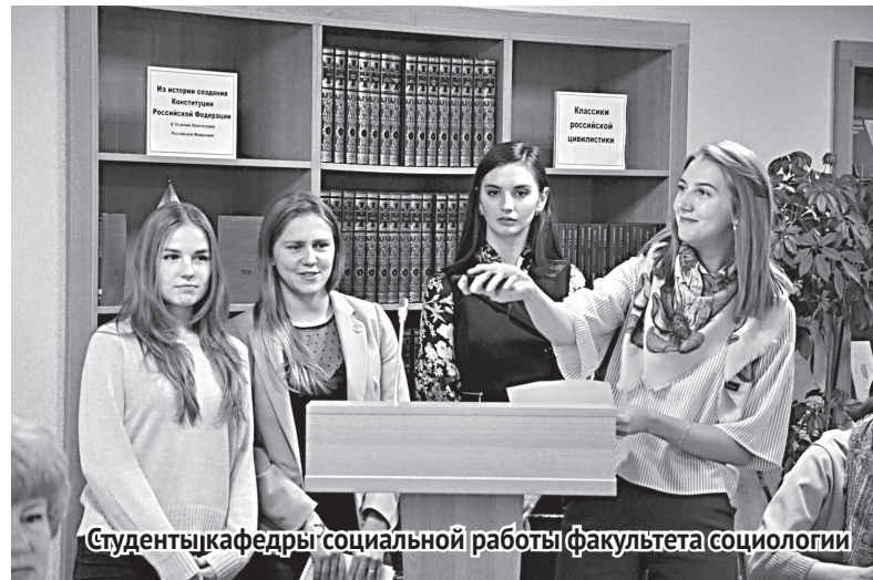
Студенты кафедры социальной работы факультета социологии

Действительно, добровольцам открывается множество дверей, за которыми есть те, которым необходима их помощь. Потенциал развития добровольчества раскрывается, с одной стороны, развитием личности самого человека, а с другой – возможностью менять и преобразовывать мир собственными руками.