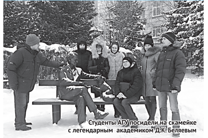
Студенты АГУ посидели на скамейке с легендарным академиком Д.К. Беляевым

Следующим пунктом было посещение ЦКП – лаборатории искусственно выращивания растений. Данная лаборатория имеет в своем составе семь секций. Основное направление работ –