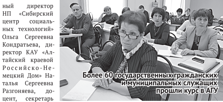
Более 60 государственных гражданских и муниципальных служащих прошли курс в АГУ