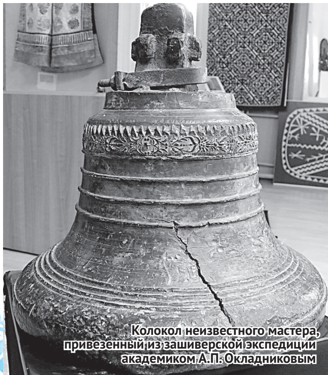
Колокол неизвестного мастера, привезенный из зашиверской экспедиции академиком А.П. Окладниковым

Колокол должен звучать, а разбитый – словно немой человек. Мы собираем безголосые колокола Сибири, чтобы узнать, как же они звучали несколько столетий назад. Проект так и называется: «Вернем колоколу голос». В 2018 году мы получили на него грант, закупили оборудование – литейную печь, 3D-сканер, портативный анализатор определения химического состава металла. За пятнадцать лет объездили всю Сибирь – от Тобольска до Дальнего Востока – и нашли около 300 дореволюционных колоколов. В проект по отливке копий попали лишь 22 из них, они были отсканированы, исследованы на химический состав. Почти всю длительную работу по подготовке к литью мы осуществили, но уложиться в отведенное грантодателем время нам не удалось. Заявленные по проекту колокола теперь готовим к литью основательно и неспешно, авральное выполнение работ здесь невозможно, поскольку дело это всегда идет непросто – слишком велика ответственность и опасность этого трудоемкого производства. Надеюсь, июнь-июль – как раз та пора, когда мы приступим к литью. Возможно, первыми станут алтайские колокола.