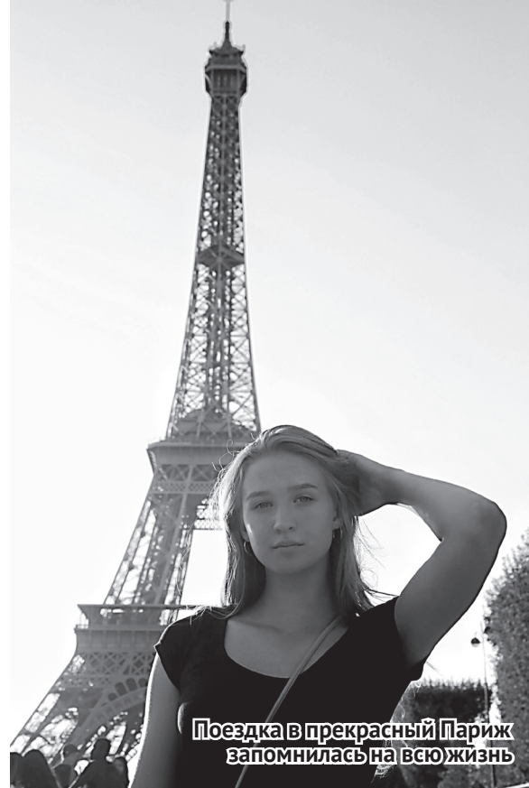
Поездка в прекрасный Париж запомнилась на всю жизнь

Также нельзя не отметить уважение французов к каждому композитору. После парадов организаторы фестиваля подходили к оркестрантам и просили назвать список исполненных песен, чтобы заплатить за авторское право. Естественно, у всех нас это вызывало огром-