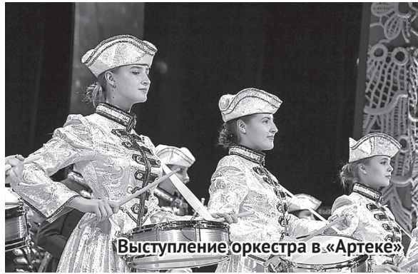
Выступление оркестра в «Артеке»

Мы играли и популярные французские мелодии, и известные английские песни, и танцевали под