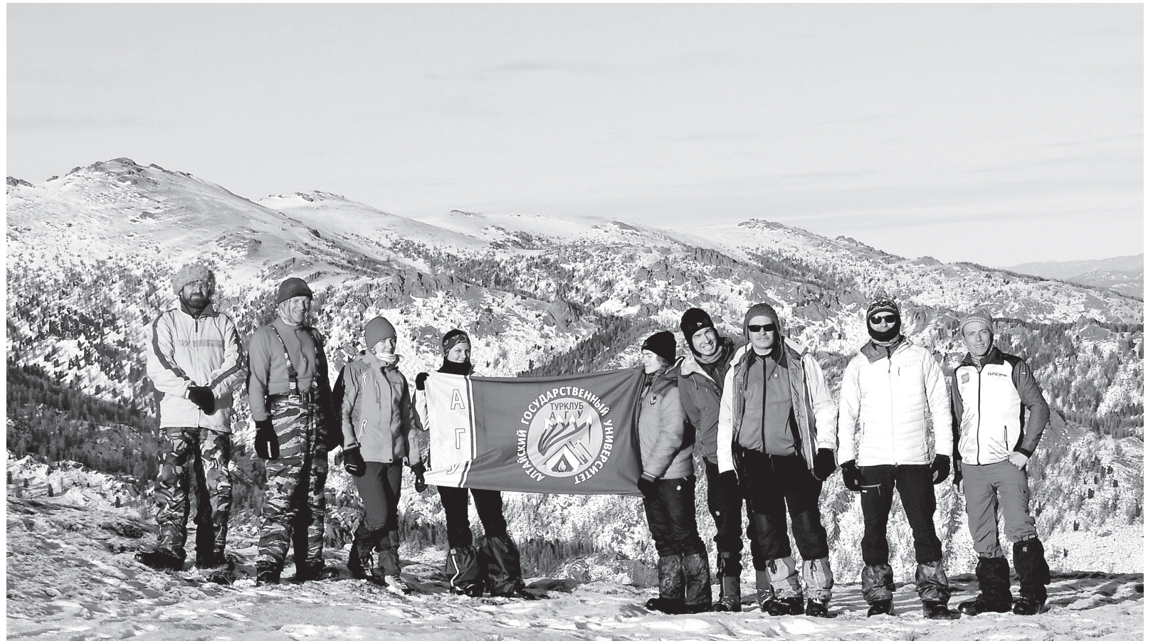
Перевал в Коргонском хребте

Сейчас положение несколько лучше, чем было раньше. Появились готовые программы маршрутов для студентов, у учащихся есть доступ к более комфортным условиям во время экспедиции: транспорт, что может довести до начала маршрута, новое походное оборудование. Однако главной проблемой остается слабая