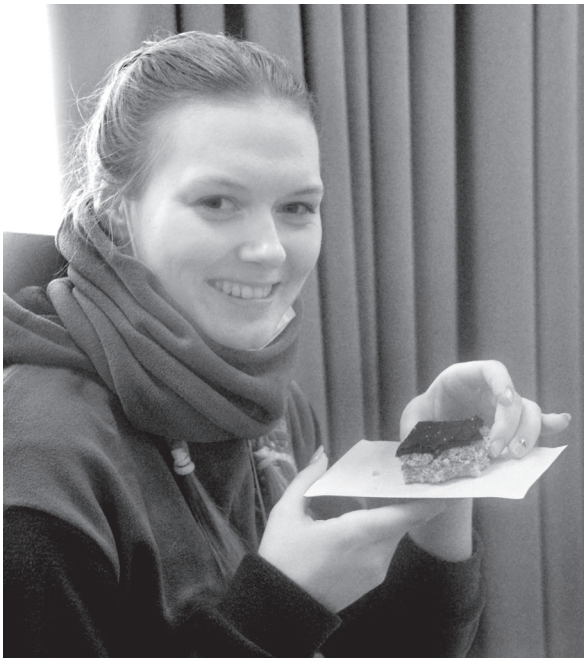
Бойцы «Снежного десанта» тоже оценили пряник