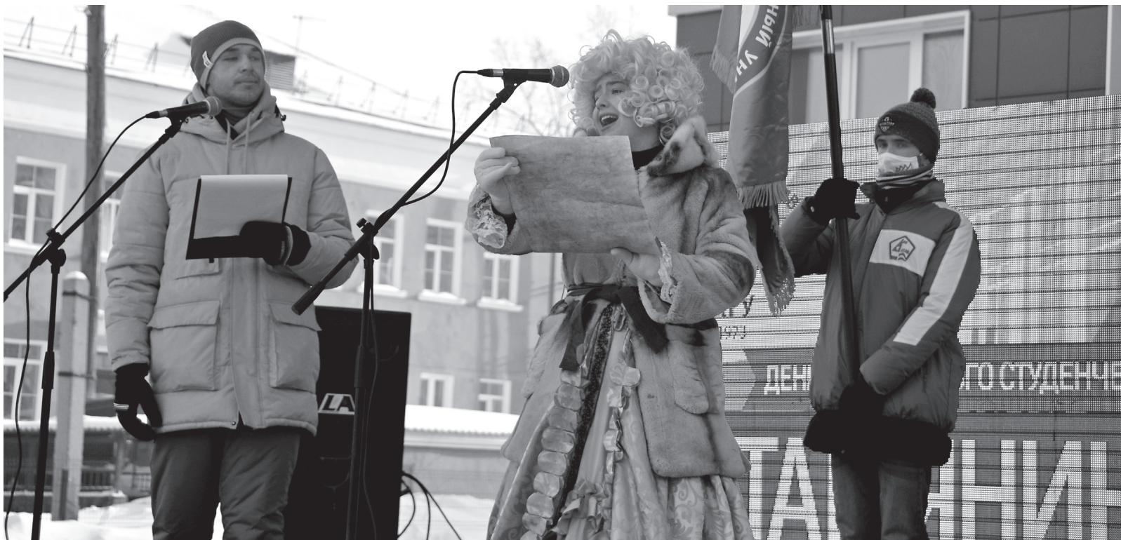
Императрица Елизавета Петровна зачитывает указ об открытии первого в России университета

Рассказываем, как в опорном АГУ отметили День российского студенчества – 2021