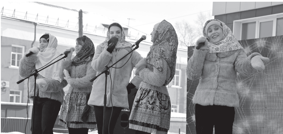
Музыкальный подарок студентам – выступление коллектива «Сибиря»