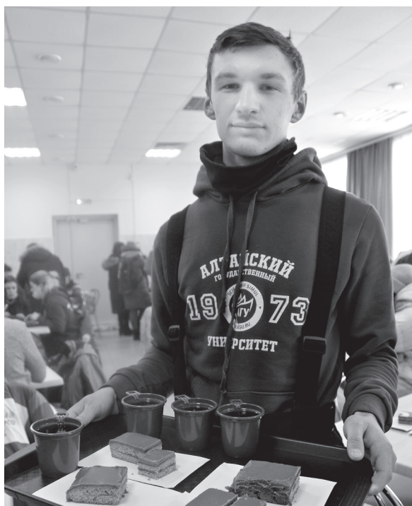
Праздничное угощение – медовый пряник и сбитень

Традиционный праздник в честь студенчества начался с согревающих улыбок, жарких встреч с товарищами и... выбора теплой одежды.