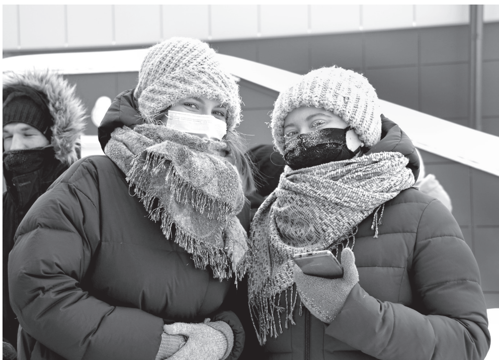
Мороз веселью не помеха!