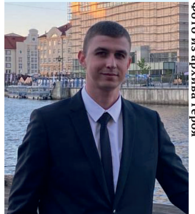
Фото из архива героя