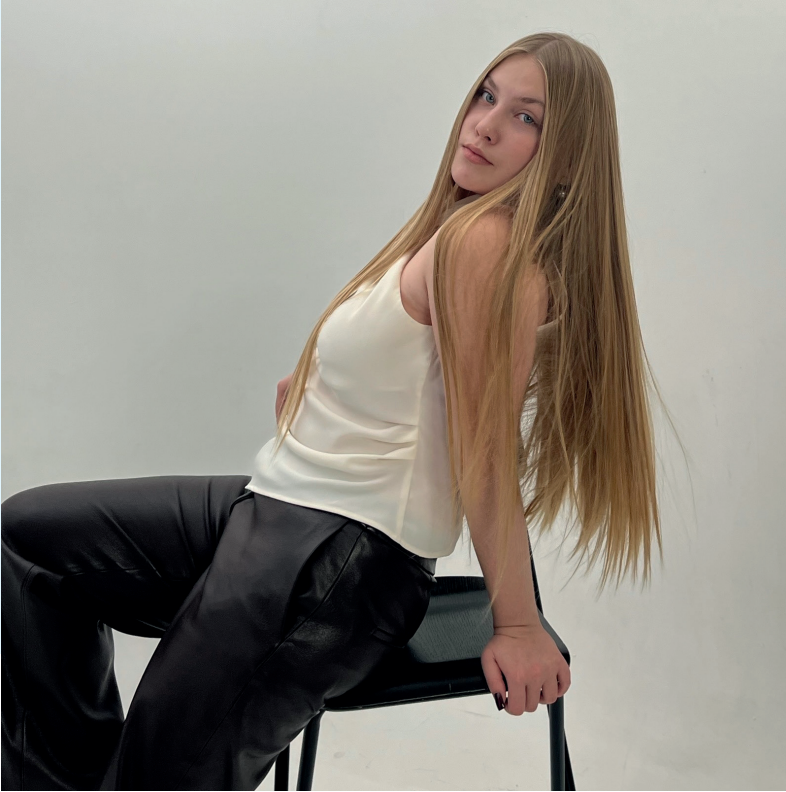
Фото из архива героя